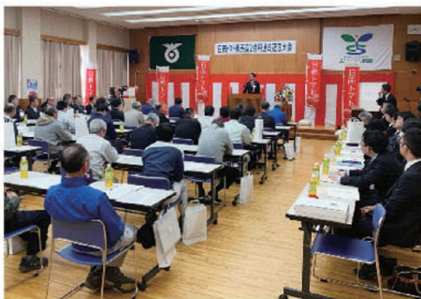
JA鳥取西部 日南トマト販売高2億円達成記念大会

しかし、生産者の高齢化や様々な気象災害の影響から栽培面積が減少するなど、平成11年度の1億8千900万円をピークに販売額は減少の一途をたどってきました。